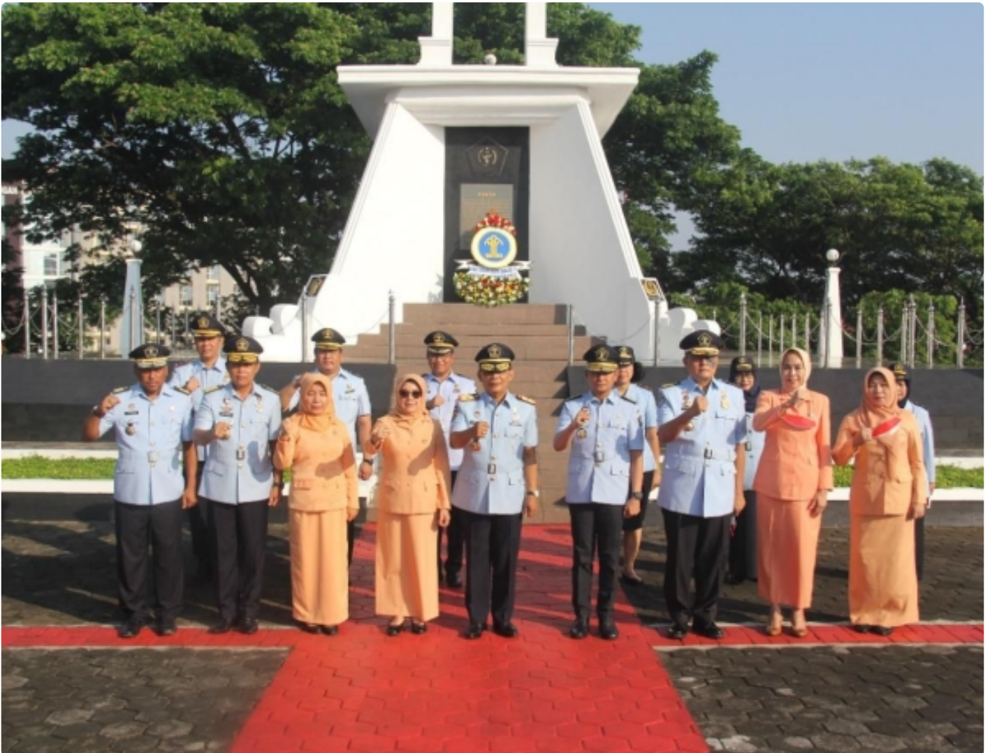
Sambut Hari Dharma Karyadhika Ke-77, Kemenkumham Jateng Gelar Upacara Tabur Bunga di TMP Giri Tunggal

SEMARANG - Bangsa yang besar adalah bangsa yang menghargai jasa para pahlawannya. Atas dasar itu, jajaran Kantor Wilayah Kementerian Hukum dan